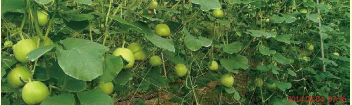
▲照片1:嘉玉美濃瓜，拍照日8月4號，請看封底宅配介紹。