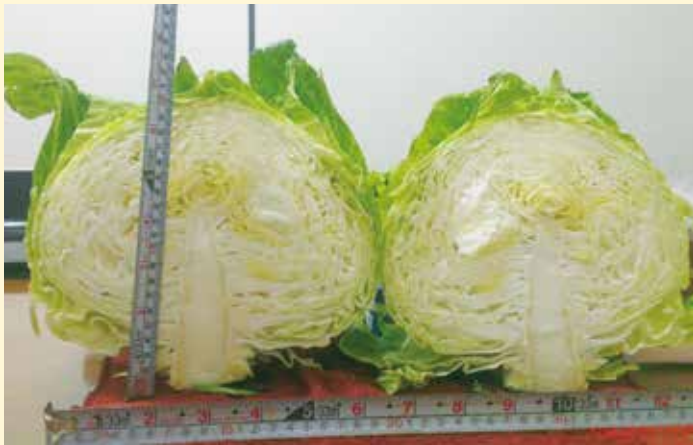
▲照片2:海拔1800初秋高麗菜，4公斤半重，拍照日8月3號，已採起來放冰箱7天了。